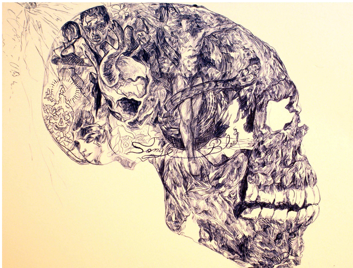
« vanité au Christ ». stylo bille sur papier. 60x60cm. 2009